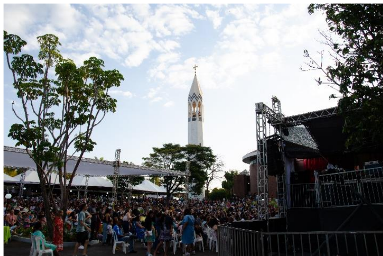
Jornada de Portas Abertas